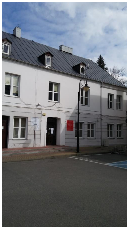
Widok na elewację budynku po zakończeniu prac remontowych.