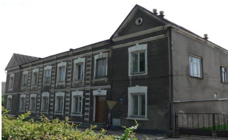
Widok budynku przed wykonaniem prac restauratorskich