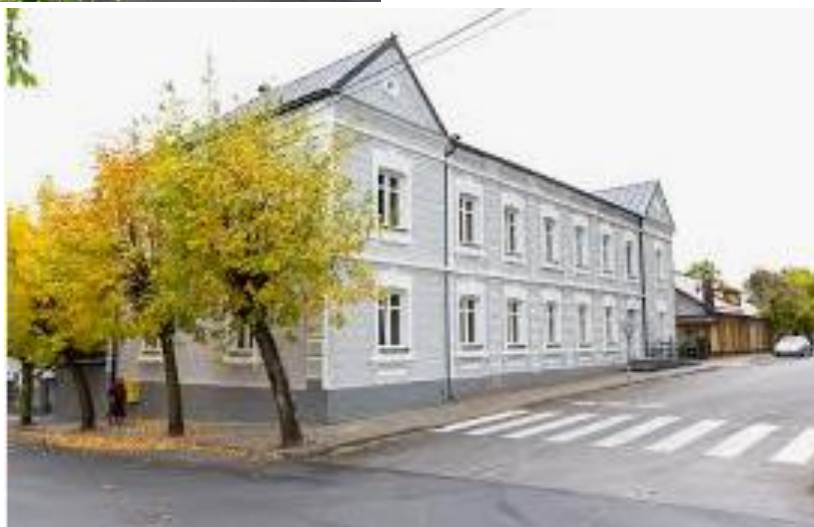
Efekty prac rewitalizacyjnych