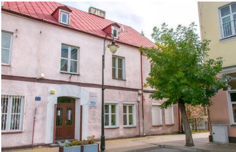
Widok na elewację budynku przed remontem