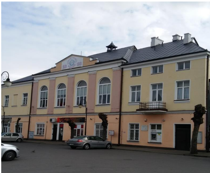
Widok na budynek remizy OSP z nowym pokryciem dachowym