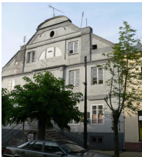
Widok kamienicy przed wykonaniem prac restauratorskich.