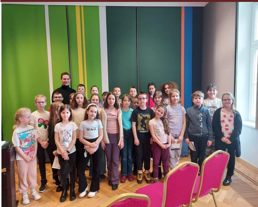
Dzieci ze Szkoły Muzycznej I stopnia w Gąbinie podczas zajęć.