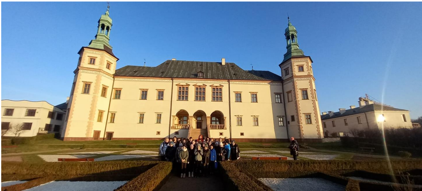
Wycieczka w ramach projektu „Poznaj Polskę”.

Szkoły prowadzone przez Miasto i Gminę Gąbin skorzystały z programu również wiosną 2023r. Szkoła Podstawowa im. Marszałka Józefa Piłsudskiego zorganizowała wycieczkę jednodniową, dla uczniów klas I-III do Ciechocinka oraz wycieczkę trzydniową, dla uczniów klas IV-VIII do Poznania. Celem wycieczek była edukacja historyczna, patriotyczna oraz kształtowanie szacunku dla dziedzictwa narodowego. Szkoła Podstawowa im. Obrońców Dobrzykowa z 1939r. w Dobrzykowie zorganizowała wycieczkę jednodniową do Gdańska, aby zobaczyć Europejskie Centrum Solidarności. Miasto i Gmina Gąbin pozyskało na ten cel łącznie 26.000 zł, a wkład własny stanowił 6500 zł.