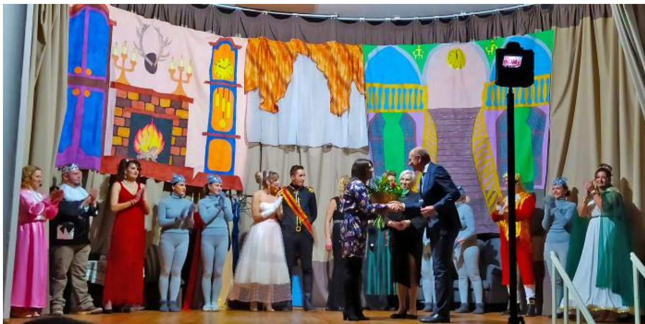
Przedstawienie teatralne „Kopciuszek” w ramach akcji „Rodzice-dzieciom”.