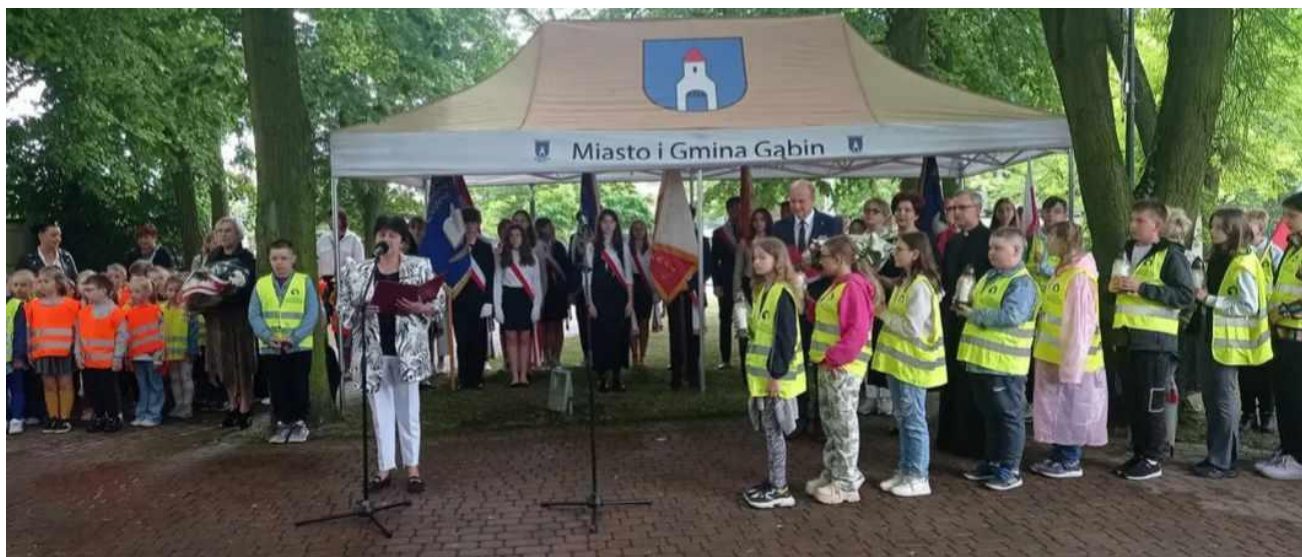
Uroczystość 15 rozstrzelanych mieszkańców Gąbina, w czasie II Wojny Światowej.