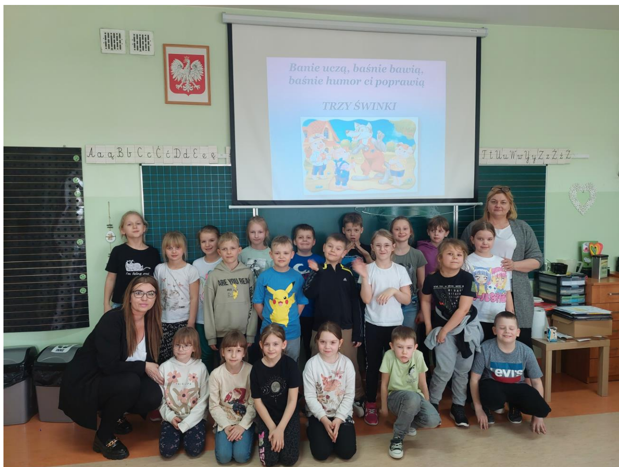
Program własny, „Baśnie uczą, baśnie bawią”.