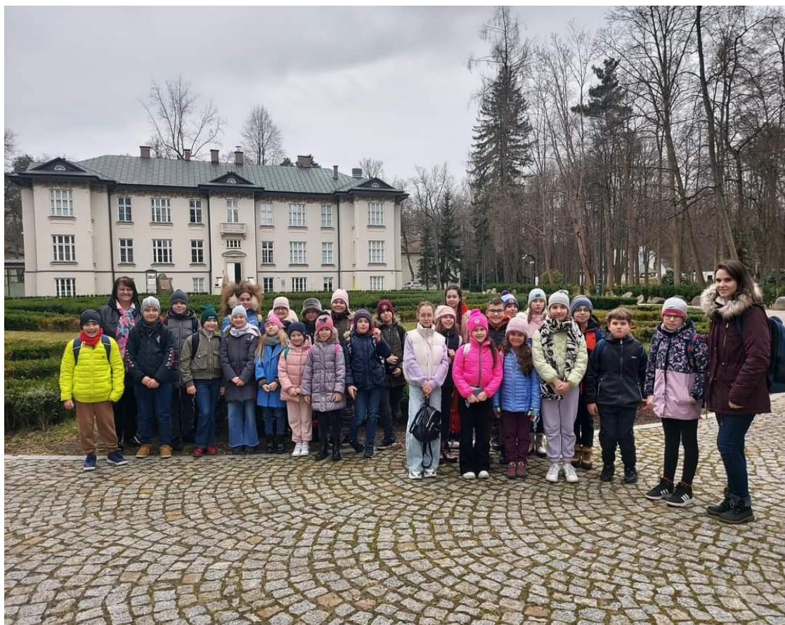
Wycieczka uczniów ze Szkoły Muzycznej do Centrum Folkloru Polskiego w Karolinie.