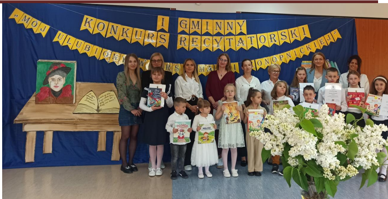
I Gminny Konkurs Recytatorski.