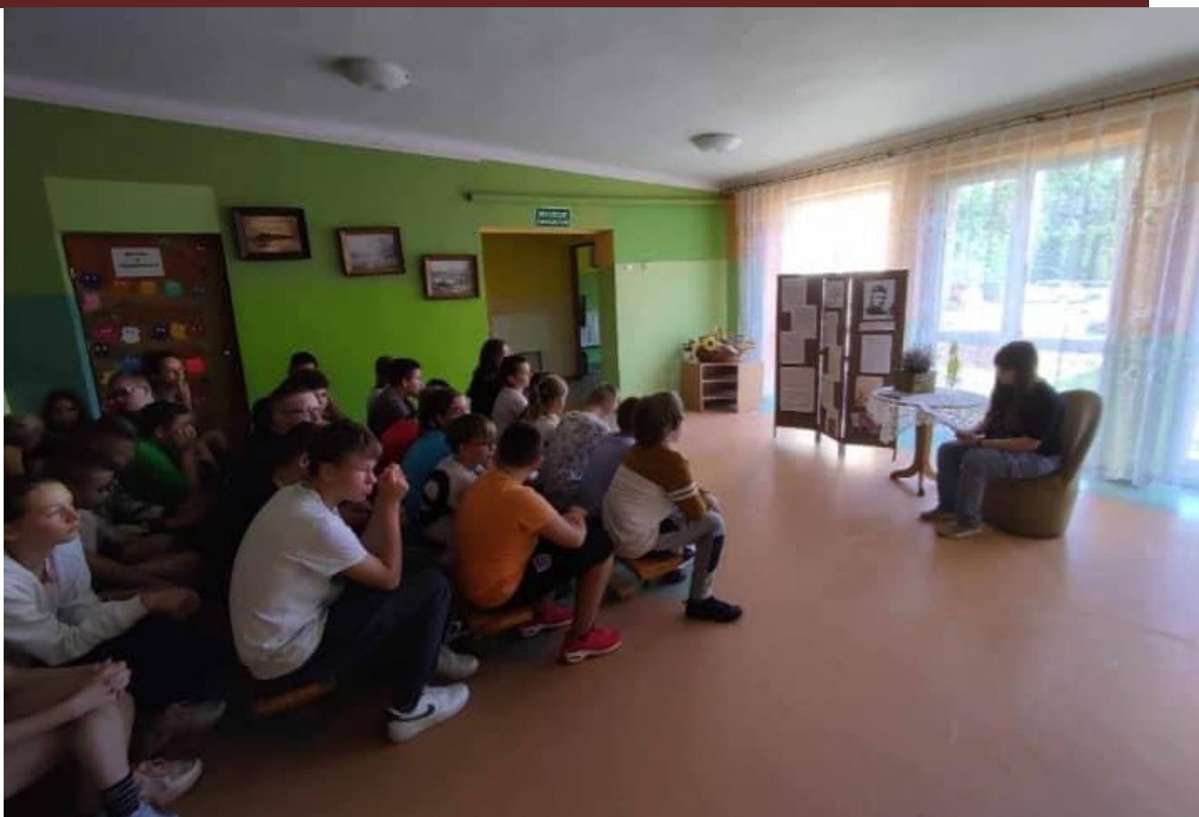
Promocja czytelnictwa w Szkole Podstawowej w Borkach.

Poznaj Polskę – program, który zakładał wsparcie organów prowadzących publiczne i niepubliczne szkoły dla dzieci i młodzieży w realizacji zadań mających na celu uatrakcyjnienie procesu edukacyjnego dzieci i młodzieży poprzez umożliwienie im poznawania Polski, jej środowiska przyrodniczego, tradycji, zabytków kultury i historii oraz osiągnięć polskiej nauki. Przedsięwzięcie miało na celu wspomóc realizację podstaw programowych dla szkół podstawowych i ponadpodstawowych oraz urozmaicić zajęcia lekcyjne. Uczenie się oparte na praktycznym odkrywaniu śladów historii, czy też eksperymentowaniu w centrach nauki stworzyło uczniom warunki do zdobywania nowych umiejętności w niepowtarzalnym środowisku edukacyjnym. Szkoła Podstawowa w Czerminie oraz Szkoła Podstawowa w Nowym Kamieniu uzyskała dofinansowanie z Ministerstwa Edukacji i Nauki w formie dotacji celowej na dofinansowanie wycieczek szkolnych związanych z priorytetowymi obszarami edukacyjnymi wskazanymi przez Ministra . W ramach „Poznaj Polskę” dofinansowaniu w 80% podlegały wycieczki: