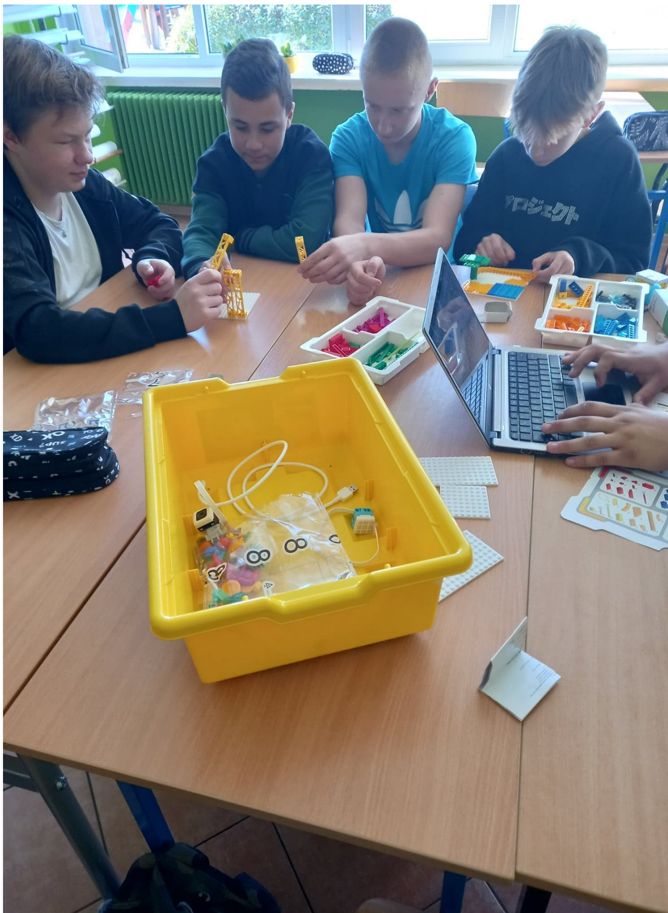
Laboratoria Przyszłości w Szkole Podstawowej w Borkach