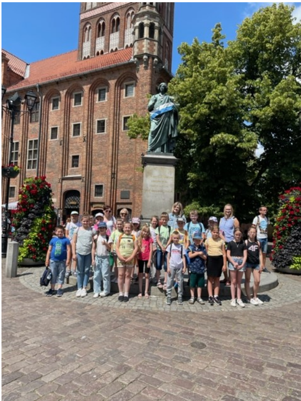
Wycieczka do Krakowa w ramach programu „Poznaj Polskę” dzieci ze Szkoły Podstawowej w Cermnie p- fot. ze zbiorów szkoły.