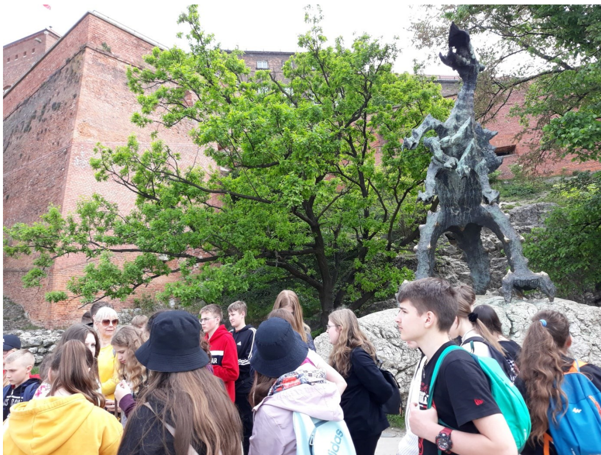
Wycieczka do Krakowa w ramach „Poznaj Polskę” dzieci ze Szkoły Podstawowej w Czermnie – fot. ze zbiorów szkoły.