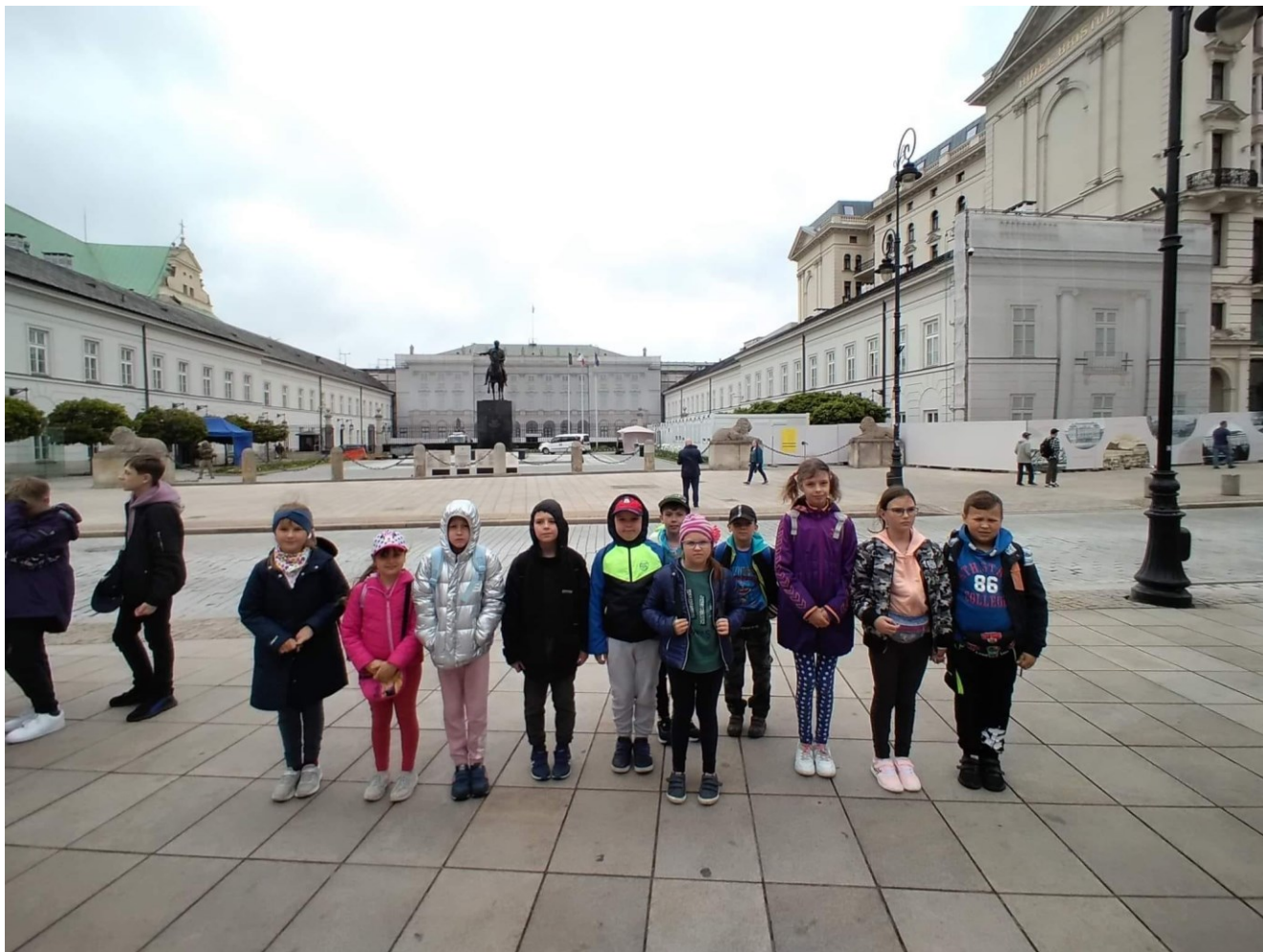
Wycieczka dwudniowa dzieci ze Szkoły Podstawowej w Nowym Kamieniu – fot. z zasobów szkoły.