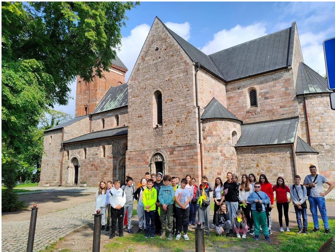
Wycieczka jednodniowa dzieci ze Szkoły Podstawowej w Nowym Kamieniu