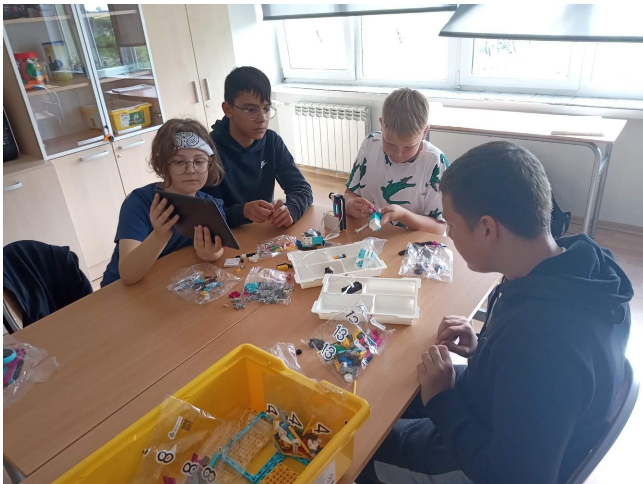
Laboratoria Przyszłości Szkoła Podstawowa w Nowym Kamieniu