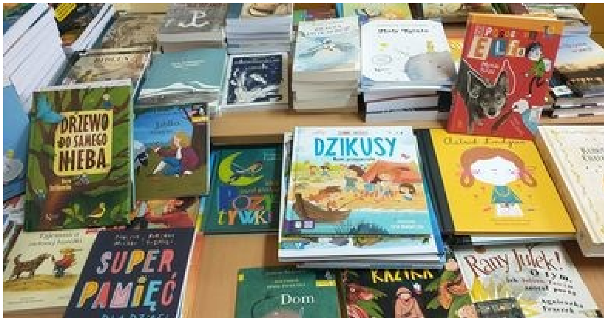
Książki zakupione z Narodowego Programu Rozwoju Czytelnictwa do Szkoły Podstawowej w Nowym Kamieniu – fot. ze zbiorów szkoły.

Doposażenie biblioteki szkolnej ww. atrakcyjne dla uczniów książki ułatwiło realizację celów kształcenia w zakresie edukacji czytelniczej i medialnej. Program spowodował wzmocnienie zainteresowań aktywności czytelniczej uczniów oraz wzmocnienie roli biblioteki szkolnej, poprzez uatrakcyjnienie księgozbioru biblioteki szkolnej.