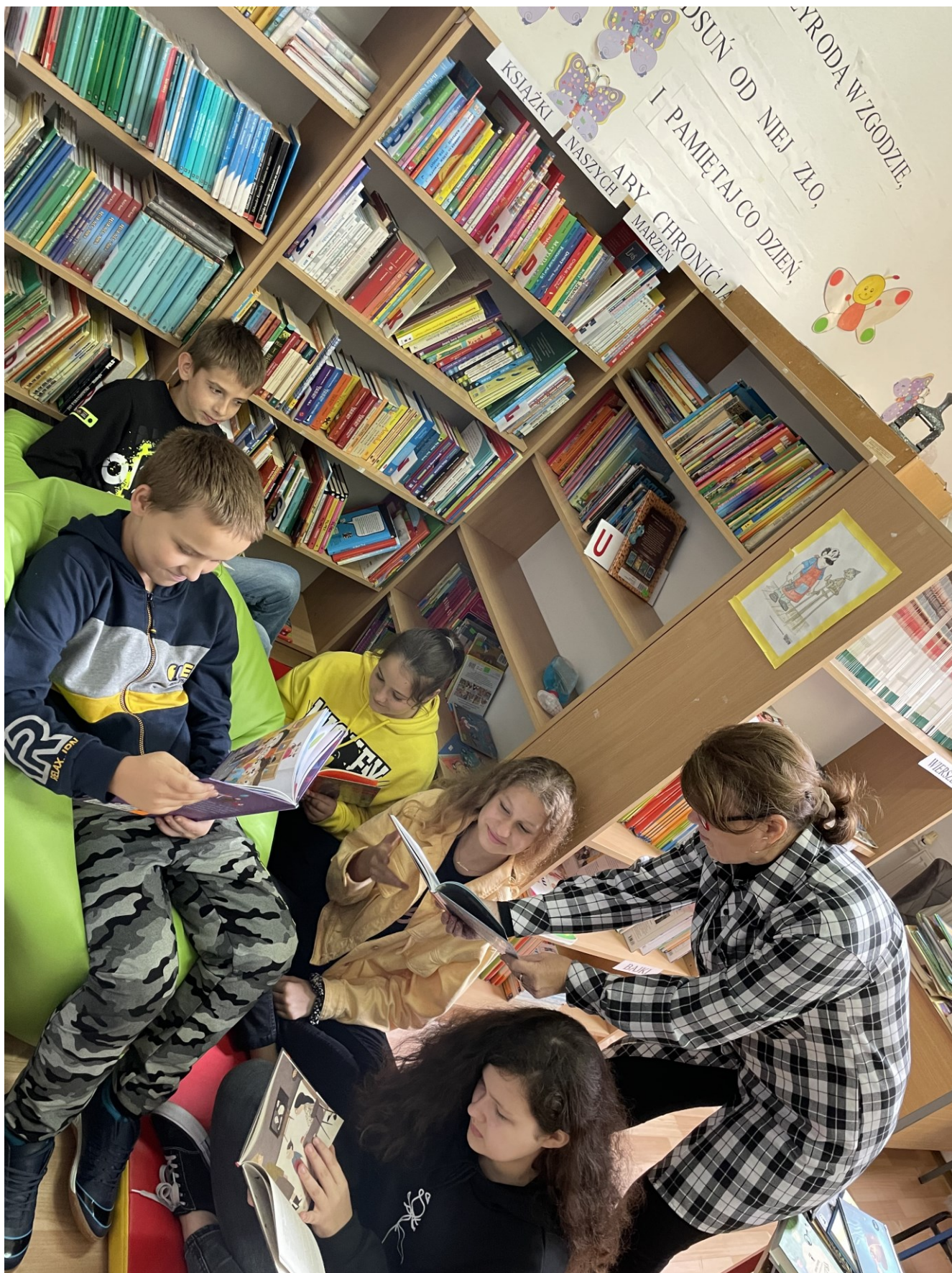
Narodowy Program Rozwoju Czytelnictwa – książki zakupione w ramach projektu do Szkoły Podstawowej w Czermnie.