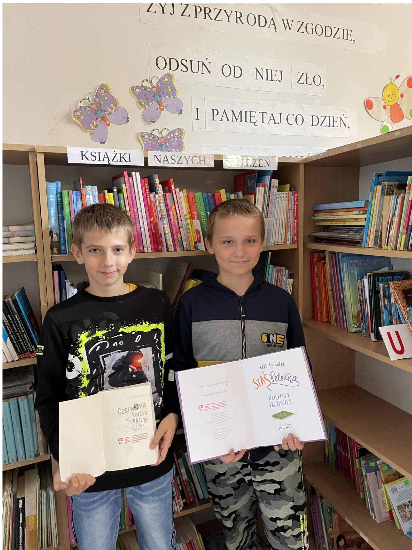
Narodowy Program Rozwoju Czytelnictwa – książki zakupione w ramach projektu do Szkoły Podstawowej w Czerminie.