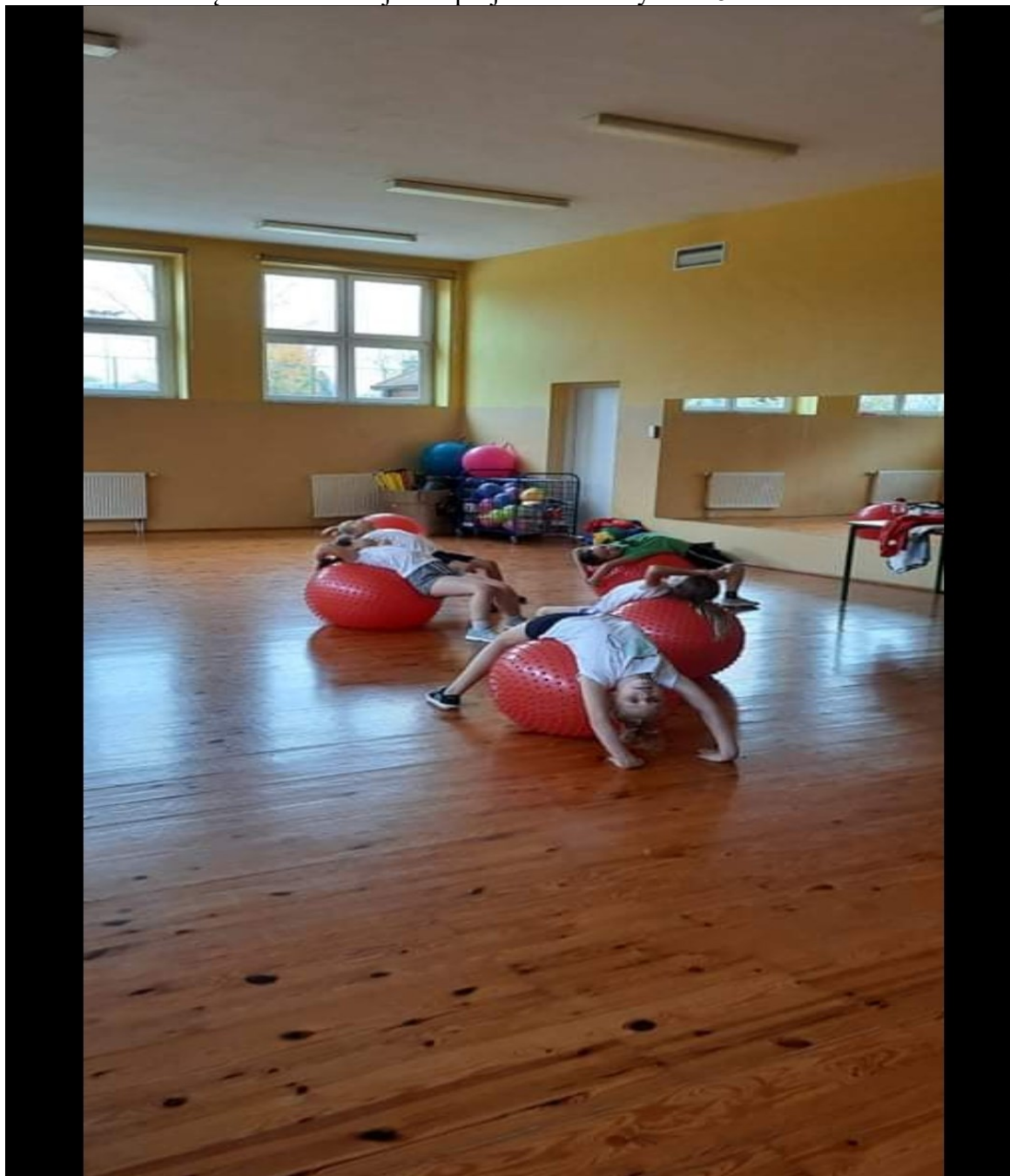
Zajęcia z gimnastyki korekcyjno-kompensacyjnej w Szkole Podstawowej w Dobrzykowie – fot. ze zbiorów szkoły.

Miasto i Gmina Gąbin do realizacji obu projektów dołożyło 21.821 zł