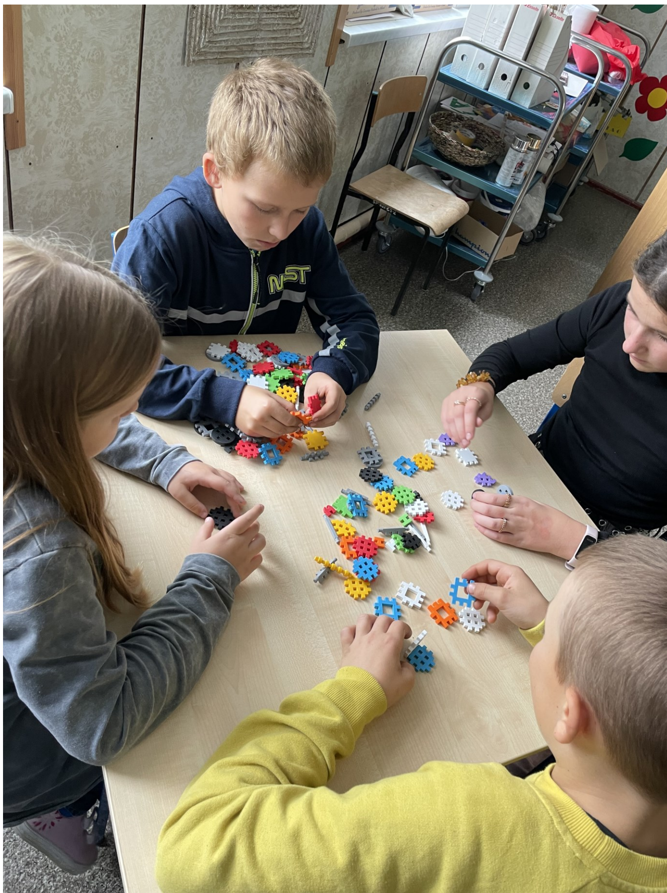
Laboratoria Przyszłości- Szkoła Podstawowa w Czermnie – fot. ze zbiorów szkoły.