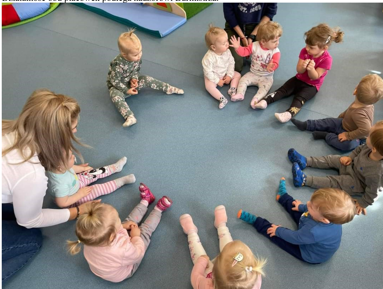
Żłobek Samorządowy w Dobrzykowie – fot. ze zbiorów żłobka.

Działalność obu placówek podlega nadzorowi Burmistrza.