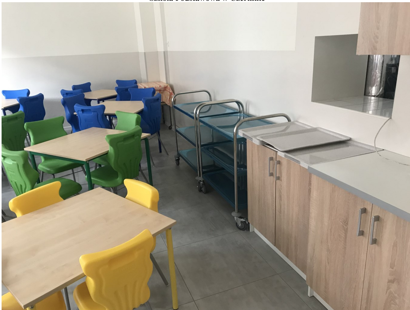
Szkoła Podstawowa w Czermnie