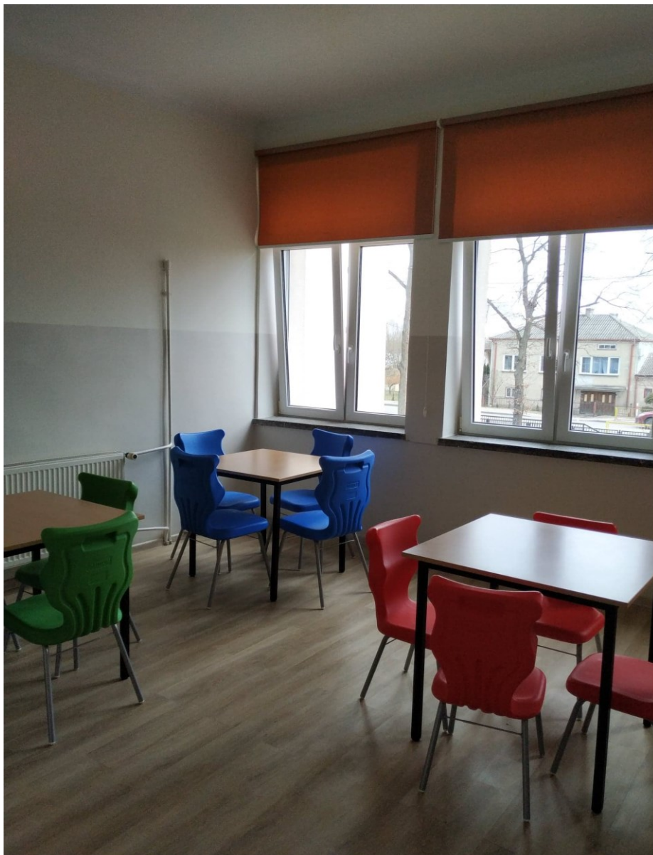
Szkoła Podstawowa w Dobrzykowie