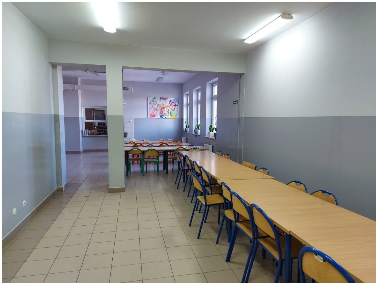
Szkoła Podstawowa w Gąbinie