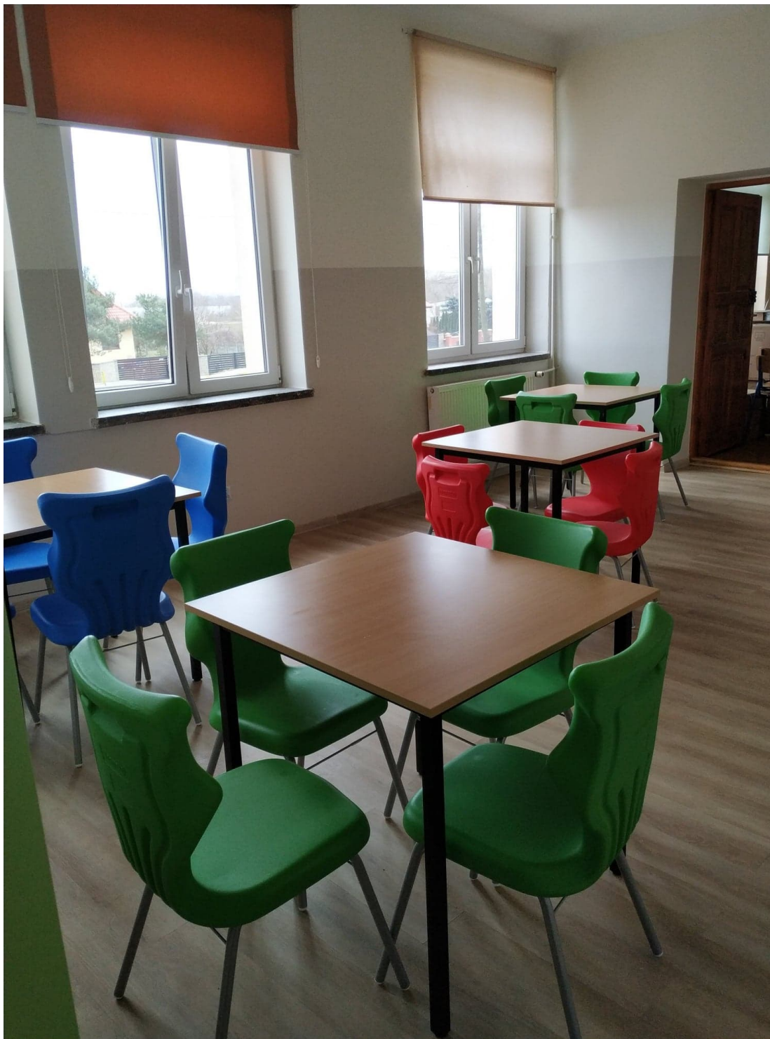
Szkoła Podstawowa w Dobrzykowie